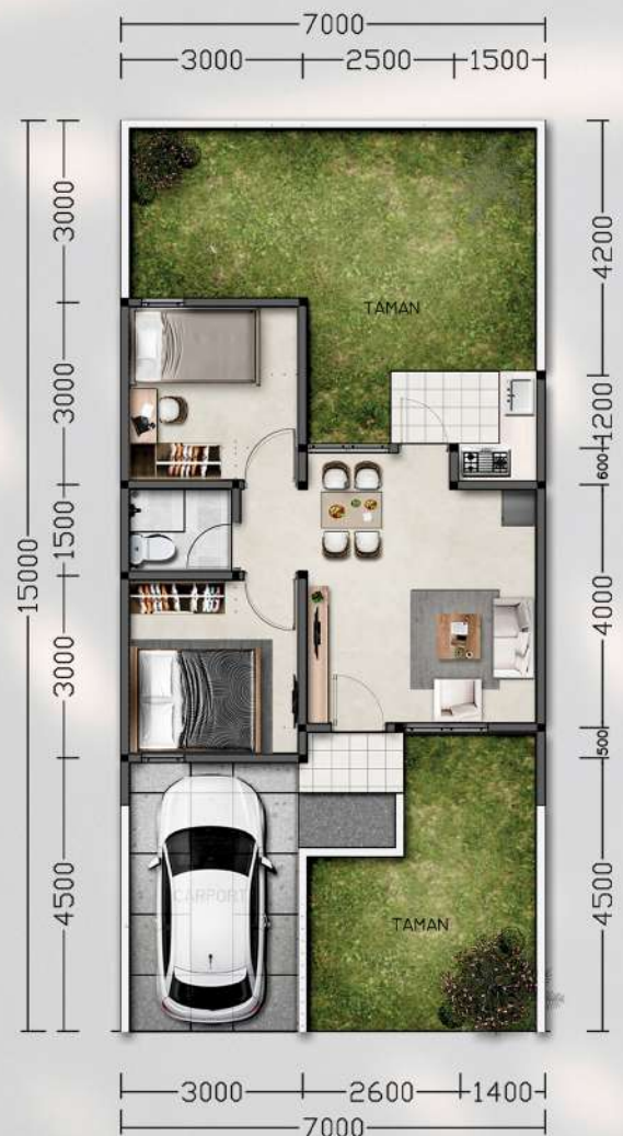
Denah LB 45 m 2 STD, 2 Kamar Tidur