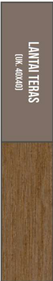
TEXAS WALNUT EX. MILAN