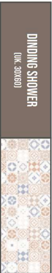
TRISTA GEO EX. HABITAT