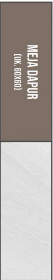
EDEN GRIS EX. HABITAT