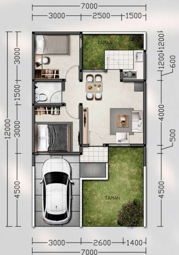
Denah LB 45 m 2 LT 84, 2 Kamar Tidur