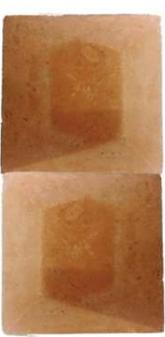
ROSTER TEMPEL TERRACOTTA KLEI