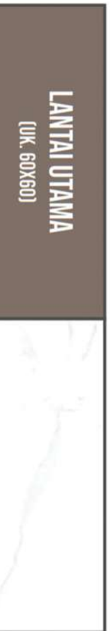
STATUARIO SNOW EX. MILAN