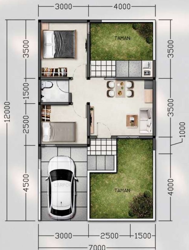
Denah LB 39 m 2 LT 84, 2 Kamar Tidur