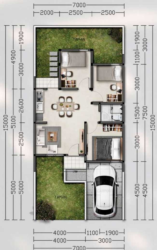
Denah LB 52 m 2 , 3 Kamar Tidur