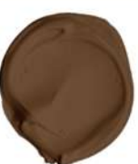
TOFFEE MACCHIATO EX. MOWILEX