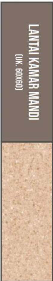
CARILLO BEIGE EX. HABITAT