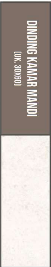
TRISTA EX. HABITAT