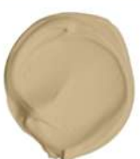
PRESTIGE BROWN EX. MOWILEX