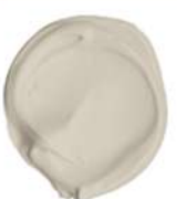
KUTA EX. MOWILEX