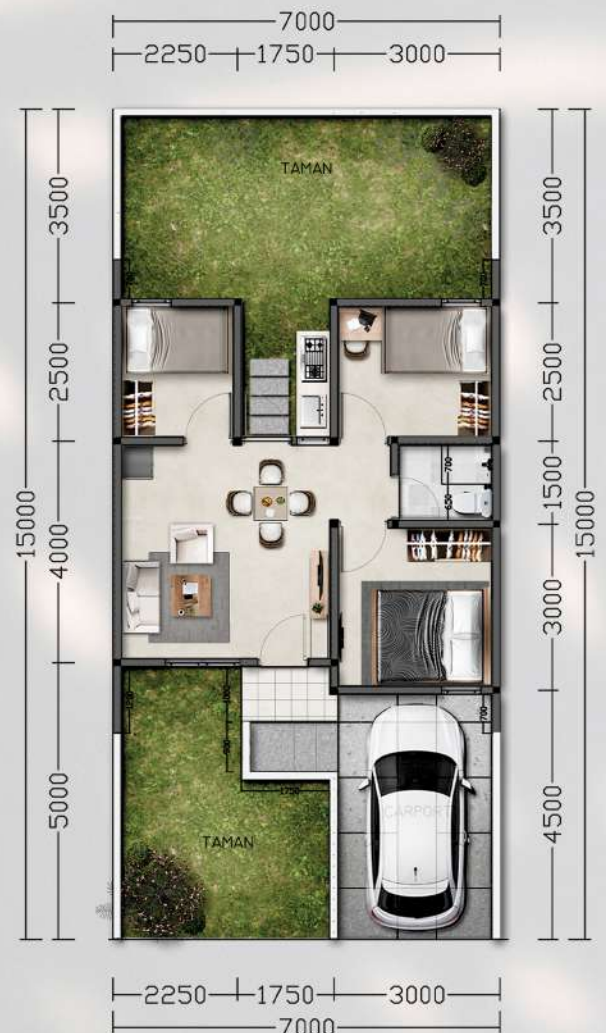
Denah LB 45 m 2 KHS, 3 Kamar Tidur